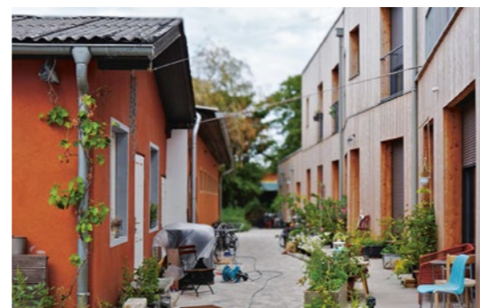
1 SchloR – Schöner Leben, Wien Fotos SchloR (1), GABU Heindl Architektur (2)