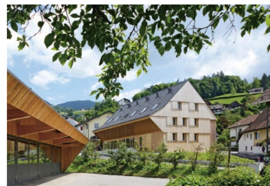
4 Ludescher + Lutz Architekten, Ernas Haus, Studentenwohnen am Winderhof, Dornbirn