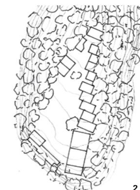
1 2 Lageplan

Warum diese doch recht massive Vergitterung der Volieren, wo doch überall in ähnlichen Situationen möglichst unsichtbare Netze verwendet werden? Das war eigentlich meine erste Frage an Mathias. Der Grund dafür ist die Sorge um die Gesundheit der Vögel, denn bei dünnen Stäben oder Gittern würden deren Augen auf die Ferne fokussieren, wodurch die Gefahr einer Verletzung entstünde, da Greifvögel auch auf kürzeste Distanzen hohe Fluggeschwindigkeit erreichen. Eine ähnliche Haltung um die Sorge der Tiere zeigt sich bei der Ausführung der Böden in den Käfigen, in denen, zwar aufwändiger in der Reinigung, Gras und Erde dominieren.