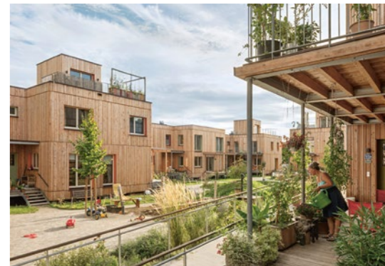
2 einszueins Architektur, Die Auenweide, St. Andrä Wördern