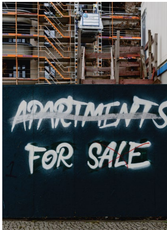
1 Julius C. Schreiner, Kapital schafft, Fotoarbeit, 2018

Die Veranstaltung ist Teil des umfangreichen Programms, mit dem das DOWAS sein 50-jähriges Bestehen feiert. Der 1975 gegründete Verein bietet als Ergänzung zu Einrichtungen der öffentlichen Sozialverwaltung alternative Modelle von Beratung, Betreuung und Unterbringung für wohnungslose Menschen an und engagiert sich darüber hinaus in Aufklärungs- und Öffentlichkeitsarbeit zu den gesellschaftlichen Ursachen von Armut, Ausgrenzung, Wohnungs- und Arbeitslosigkeit.