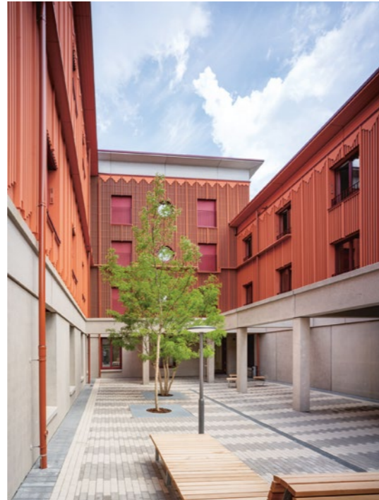
1 Übernachtungsschutz Lotte-Branz-Straße, München

In seinem Vortrag zeigt Haber anhand von Beispielen wie dem Wohnbau am Hohentorsplatz in Bremen oder dem IBA'27 Quartier in Stuttgart auf, wie mit genuin architektonischen Mitteln auch ökonomisch positive Effekte erzielt werden können. Dabei stellt er auch das jüngst beim BDA Preis Bayern ausgezeichnete Projekt Übernachtungsschutz München vor, einen Neubau mit 730 Übernachtungsplätzen für obdachlose Männer, Frauen und Familien. Entgegen der sonst üblichen Monotonie von Containerbauten gestalteten Hild und K äußerst sorgsam einen Neubau aus acht zueinander versetzten Baukörpern mit geschützten Höfen, in dem Menschen, die sich selbst „bezahlbaren“ Wohnraum nicht mehr leisten können, eine „Heimat auf Zeit“ finden.