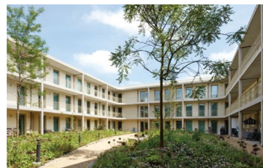
1 Golvenstraat, Ostende 2 Eenhoornblokken, Amsterdam