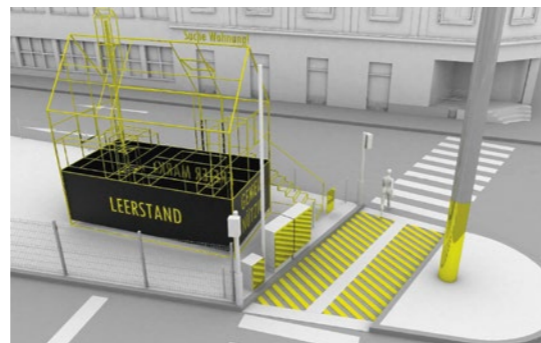
2 Visualisierung columbosnext