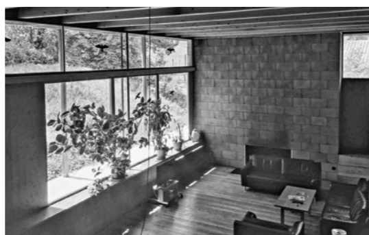
1 Chill Out, Innsbruck