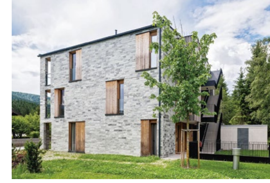
1,3 Wohn- und Geschäftshaus Akzent, Sulz (Marte, Marte) mit StoVentec R, StoSignature, StoColor Dryonic, StoColor Metallic

Wir sagen Danke und freuen uns, in dieser Ausgabe einige Projekte und Ideen vorzustellen, die Architekt:innen mit der Materialvielfalt von Sto realisieren konnten.