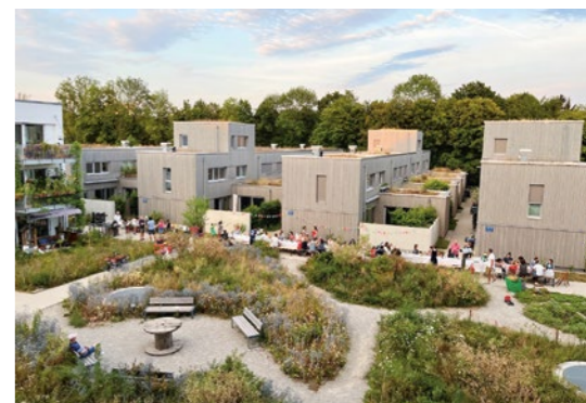
3 dressler mayerhofer rössler, Der kleine Prinz, München