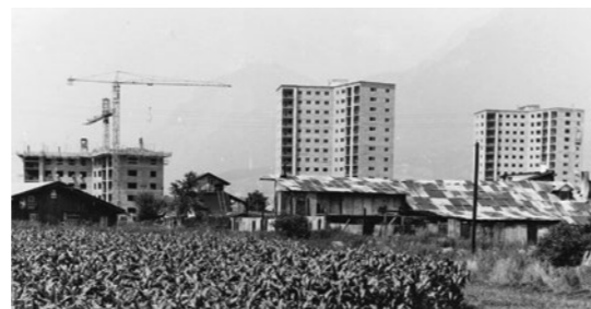
1 Bocksiedlung, Innsbruck

Ab 2. Oktober wird zudem eine temporäre Installation von columbosnext Leerstand ganz unmittelbar im öffentlichen Raum sichtbar machen und zwar auf einem nach wie vor brachliegenden Grundstück, für das es eigentlich schon seit 2015 ein siegreiches Wettbewerbsprojekt gibt.