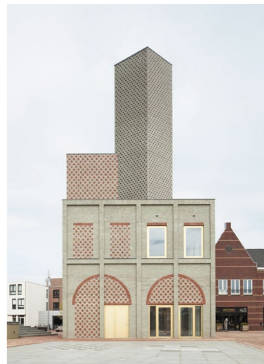
1 Landmark, Nieuw Bergen

„Thus, the question ‚How to Work Better?‘ is about re-envisioning practice itself: embracing beauty, expression, and cultural resonance as essential qualities, so that architecture not only responds to today’s challenges but also inspires, delights, and sustains human experience.“ (Job Floris)